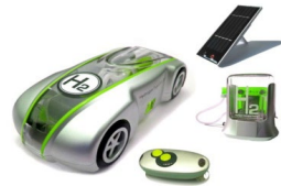
燃料電池カー-Hレーサー